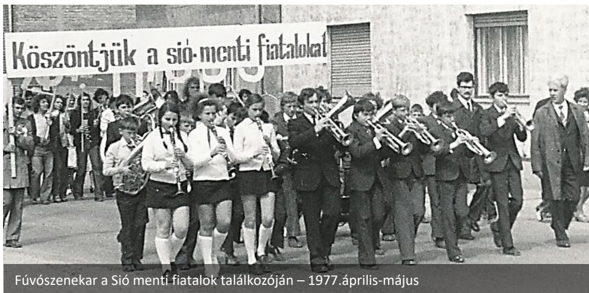
Fúvószenekar a Sió menti fiatalok találkozásán – 1977. április-május