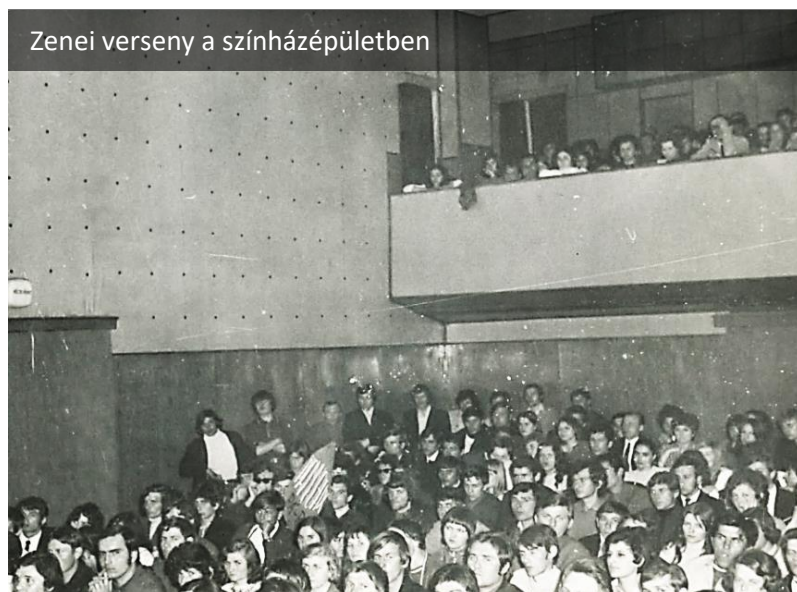
Zenei verseny a színházépületben