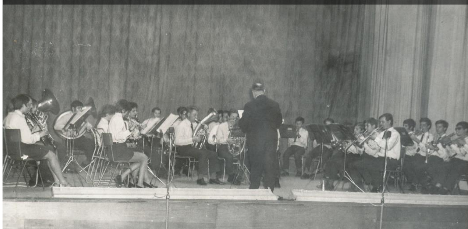
Fúvószenekar a művelődési házban – 1974.04.20