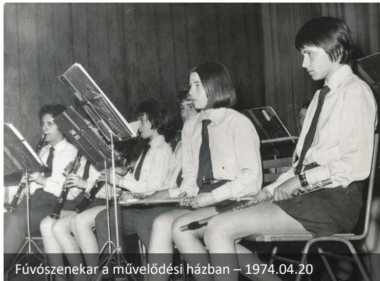
Fúvószenekar a művelődési házban – 1974.04.20

1973 óta a tamási járási és simontornyai nagyközség KISZ-bizottsága rendezték meg évente a Sió menti fiatalok találkozóját. A rendezvény 3 napos volt. 1978. április 29-május 1. találkozó programja (részlet):