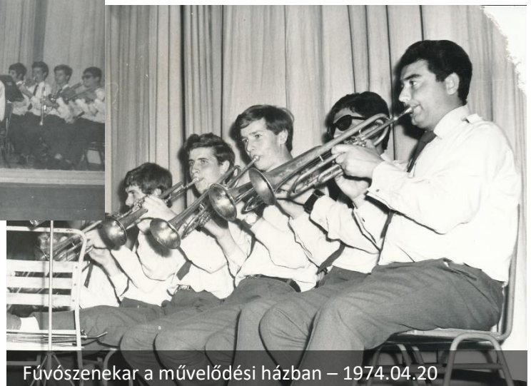
Fúvószenekar a művelődési házban – 1974.04.20