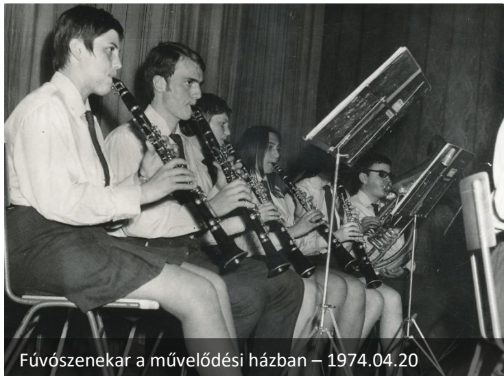
Fúvószenekar a művelődési házban – 1974.04.20